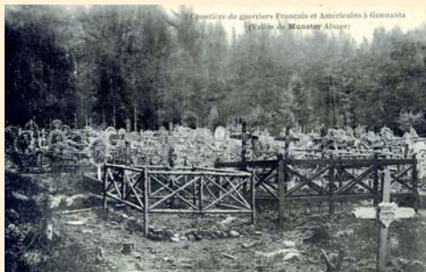
Carte postale du cimetière de Germania, éditée au lendemain de la guerre pour les nombreux visiteurs venant de toutes les régions de France.

Vous rejoindrez ensuite le chemin forestier que vous emprunterez sur environ 800 mètres. Deux tables de pique-nique se trouvent le long de ce chemin. 500 mètres plus loin, vous trouverez sur le bord droit du chemin une table tactile maçonnée 17 bis qui vous