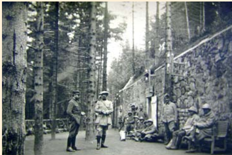
Le bâtiment principal de l'Ambulance Alpine 2/75, en 1916.

Un petit sentier vous permettra d'accéder à la base de cette plateforme 19 . Il s'agit là du bâtiment principal de l'Ambulance Alpine 2/75 implantée dans le camp Nicolas. Ce bâtiment impressionnant, long de plus de 45 mètres à l'origine, servait de corps à une dizaine de salles de soins et d'opérations chirurgicales. Un réservoir d'eau en béton est également visible sous cet ensemble construit tout en granit. D'autres abris fortifiés étaient disposés aux alentours, masqués par l'épaisse forêt de sapins. La plupart