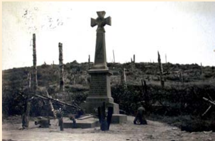
Le monument « De Guardia » au Col du Sattel en 1921.

Nécropoles Nationales du Wettstein et du Chêne Millet à Metzeral. De nombreux disparus au cours de la bataille reposent toujours en ces lieux qui sont à considérer comme un véritable sanctuaire.