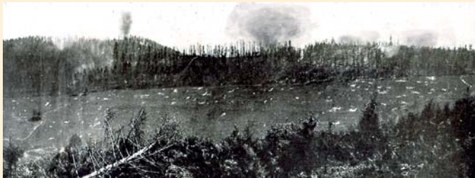
Vue d'ensemble des deux sommets du Reichackerkopf prise depuis les positions françaises du Sattelkopf en 1915.

Les Allemands repoussent les Français au-delà du col du Sattel. Ce petit col marquera, tout au long de la guerre, une barrière naturelle entre les positions allemandes du Reichackerkopf et les françaises établies sur le massif du Gaschney, jusqu'au Sattelkopf.