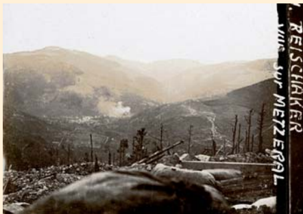
Paysage du sommet du Reichacker, vu depuis les tranchées de 1 ères lignes allemandes en direction de Metzeral.

Brunswick, décrit bien l'aspect cauchemardesque de ce lieu en 1915. "La belle forêt d'avant 1914 n'existe plus. Seuls quelques solides pins subsistent, déchirés par des milliers de projectiles. Sur le coté Est, il reste un groupe de jeunes sapins, tous sans branches ni pointes. Quelle vision tragique ! Le sommet ressemble à un désert dévasté. Des troncs d'une épaisseur d'un homme sont déchirés, pliés. Une saignée de 10 mètres a été pratiquée, les arbres couchés et reliés entre eux par du fil de fer barbelé. Un réseau de tranchées par endroits effondrées par les bombardements, le tout recouvert par de longues échardes de bois, provenant des troncs déchirés et des branches éparpillées. Des centaines de boucliers de tranchées en acier, d'obus, de bombes en tout genre, d'uniformes, d'équipements de cuir, de boîtes de soldats dont cer-