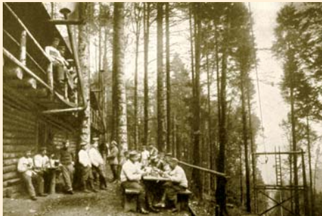
Image d'ambiance auprès d'un câble transbordeur. De nombreux hommes étaient affairés auprès de ces stations, par lesquelles transitait une grande partie des matériaux nécessaires à la vie en campagne.

Sur la partie haute de la façade se trouve une plaque de ciment portant l'inscription suivante : "Umgebaut I Ldst. Inf. Batl. Freib XIV/I Aug. 1917" ce qui signifie : Modifié par le 1 er Bataillon Territorial d'Infanterie de Freiburg en Août 1917. On peut observer à l'intérieur du bâtiment, les restes de l'armature métallique qui a été démontée par les récupérateurs de métaux après la guerre. Cela fragilise grandement la structure de ces ouvrages et doit vous inciter à la plus extrême prudence lors de vos éventuelles visites.