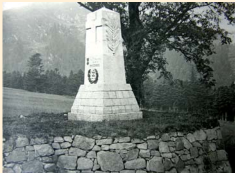
Le monument offert par la Ville de Nice dans son état de 1921.

50 mètres plus loin en arrivant aux abords d'un grand pré, vous pourrez observer le Petit Hohneck, le massif de la Schlucht ainsi que l'Altenberg.