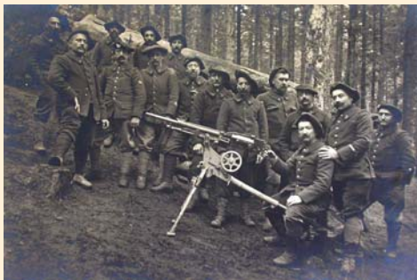
Groupe de chasseurs alpins mitrailleurs dans le bois du Sattel en 1915.

Vous suivrez ensuite le chemin balisé qui vous mènera par une pente descendante jusqu'au point