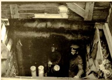
Mortier lourd allemand en position de tir au Reichackerkopf

ERHARDT d'un calibre de 245mm, sans aucun système de frein de recul. Son angle de tir était, du fait de sa position fixe, limité à bombarder le seul secteur du col du Sattel, par lequel arrivaient obligatoirement les fantassins français. Cet engin, assez archaïque, sera remplacé au cours de la guerre par le célèbre Minenwerfer, très en avance sur son temps grâce à ses innovations techniques et à sa maniabilité.