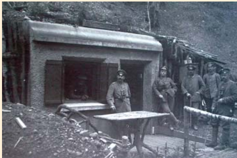
Les abris bétonnés à l'arrière du front, était bien souvent très esthétiques et de bonne finition.

vient probablement du patronyme d'un officier allemand utilisé ici de manière humoristique. Vous reprendrez ensuite le chemin qui se dirige toujours vers le Moenchberg, pendant environ 800 mètres, puis vous arriverez sur un autre chemin qu'il faudra prendre dans le sens de la montée. A cet endroit, vous pourrez